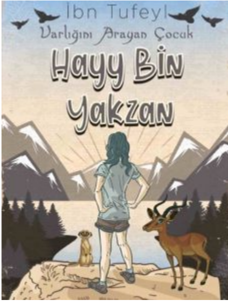
Hayy bin Yakzan

İbn Tufeyl'in Hay bin Yakzan 'ı ile Daniel Defoe'nun Robinson Crusoe 'su, farklı medeniyetlerin ve dünya görüşlerinin izlerini taşıyan, edebiyat tarihinde önemli yer edinmiş iki kurucu eserdir. Her iki metin de ıssız bir adada yalnız kalan bireyin doğa, bilgi, toplum ve inançla kurduğu ilişkiyi sorgularken; Doğu ve Batı'nın felsefi, ahlaki ve epistemolojik yaklaşımlarını anlamlandırmamıza imkân tanır. Bu metinler, sadece bireyin değil, temsil ettikleri kültürlerin özünü de açığa çıkaran birer alegori olarak okunmalıdır.